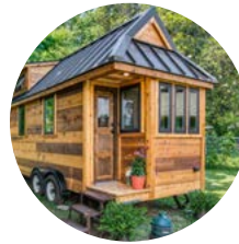
600 pi2 avec plafond